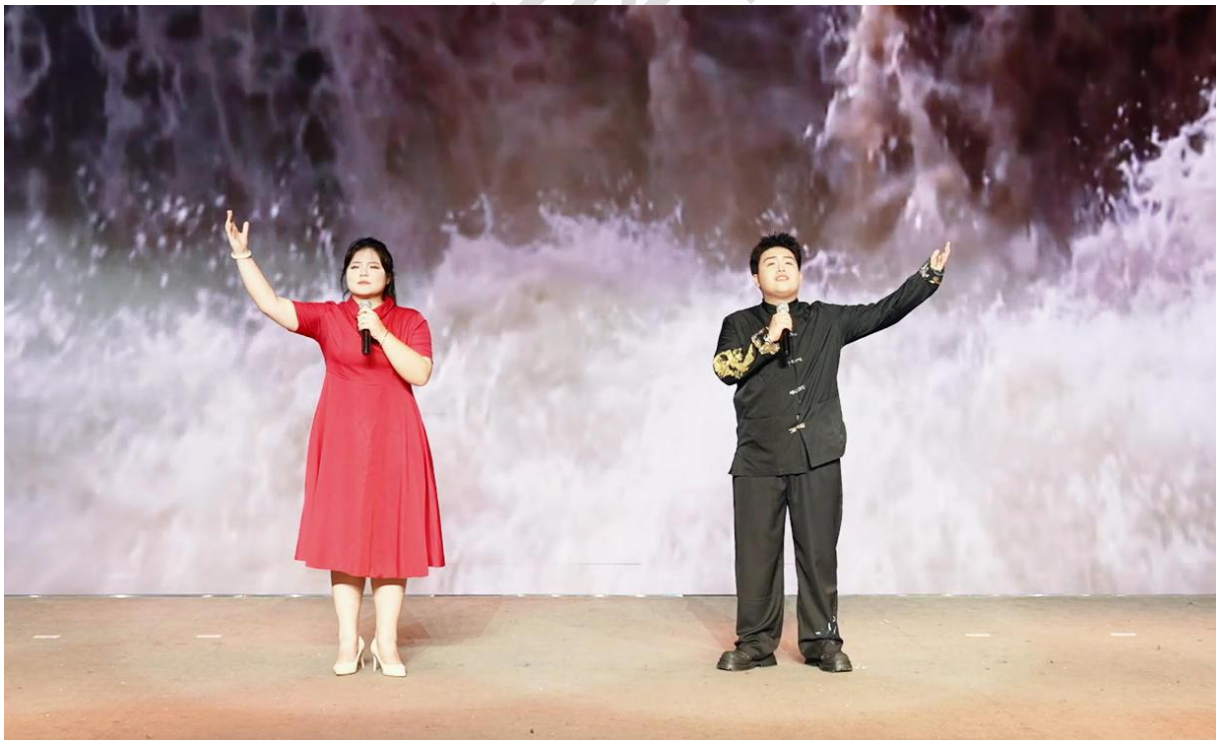
《高原，我的中国色》（白一兰、蒋恩杰）